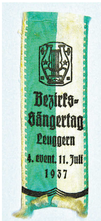
Festbändel 1937. Man war flexibel: Entweder fand das Fest am 4. Juli statt oder am 11.

nerchor Leuggern unter anderem in der Tonhalle Zürich auf. Für 2005 wird ein Publikumsaufmarsch von 1500 Personen genannt. Der Chor stand damals unter